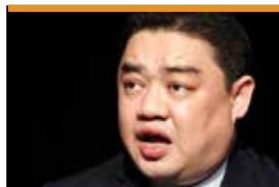
Wuer Kaixi, dissident xinès, líder de les protestes estudiantils de Tian'anmen