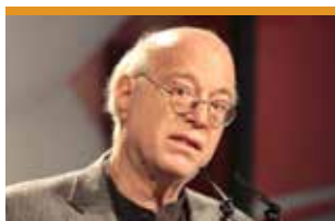
Richard Sennett, pensador nord-americà (NYU)