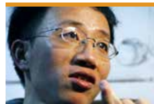
Hu Jia, blocaire i Premi Sakharov per la Llibertat de Pensament del Parlament Europeu