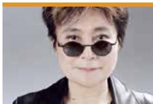
Yoko Ono Lennon, artista japonesa, cantant i activista per la pau