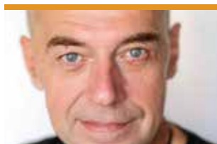
Mārtiņš Brauns, compositor letó, autor de l'himne de la Via Bàltica