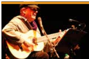
Silvio Rodríguez Domínguez, cantautor de la Nueva Trova Cubana