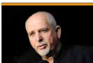
Peter Gabriel, cantautor anglès, compositor de rock i activista pels drets humans