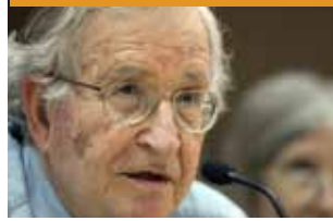
Noam Chomsky, lingüista nord-americà (MIT)