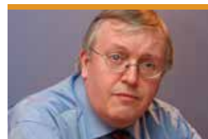
Paul Preston, historiador i hispanista anglès (LSE)