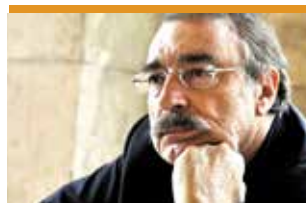
Ignacio Ramonet, periodista i exdirector de Le Monde Diplomatique