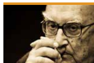
Andrea Camilleri, escriptor i director teatral italià