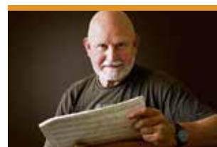
Pēteris Vasks, compositor new age letó