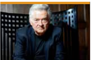
Hans Ulrich Gumbrecht, pensador alemany, catedràtic de Literatura Comparada a la Universitat de Stanford.