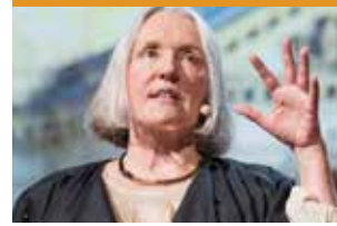
Saskia Sassen, sociòloga holandesa (Columbia)