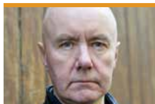
Irvine Welsh, escriptor escocès