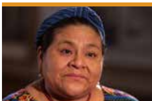
Rigoberta Menchú, líder maia quitxé a Guatemala, ambaixadora de Bona Voluntat de la UNESCO i Premi Nobel de la Pau