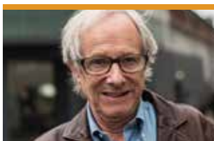
Ken Loach, director de cinema anglès