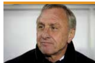
Johan Cruyff, ex-futbolista holandès (1947-2016)