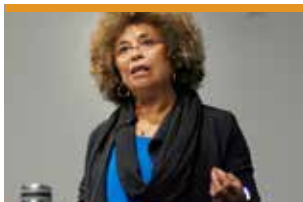
Angela Davis, activista i filòsofa afroamericana, professora a la Universitat de Califòrnia-Santa Cruz, Estats Units