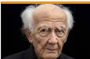
Zygmunt Bauman, sociòleg polonès (Leeds) (1925-2017)