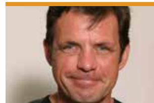
Peter Sís, escriptor i il·lustrador nord-americà, Premi Hans Christian Andersen