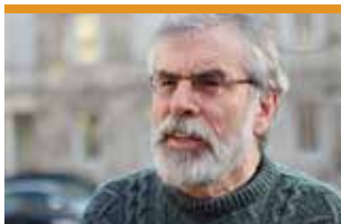
Gerry Adams, polític irlandès, president del Sinn Féin