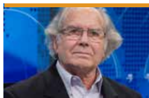
Adolfo Pérez Esquivel, pacifista argentí i Premi Nobel de la Pau