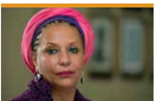
Piedad Córdoba, advocada i política, medidora de l'acord humanitari entre les FARC i el govern de Colòmbia, líder de Colombianos y Colombianas por la Paz