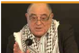
Ronald Kasrils, escriptor sud-africà, antic activista anti-apartheid i Ministre