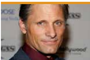
Viggo Mortensen, actor de cinema nord-americà