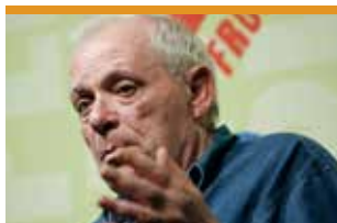
António Lobo Antunes, escriptor portuguès