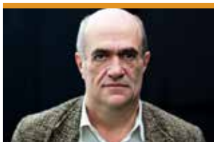
Colm Tóibín, escriptor irlandès