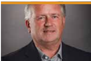
Heiner Flassbeck, ex-secretari d'estat del Ministeri de Finances d'Alemanya i Cap de la UNCTAD (Conferència de les Nacions Unides sobre Comerç i Desenvolupament) de 2003 a 2012.