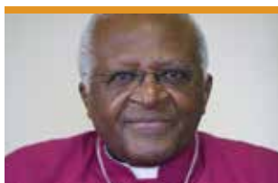
Desmond Tutu, arquebisbe sud-africà i premi Nobel de la Pau