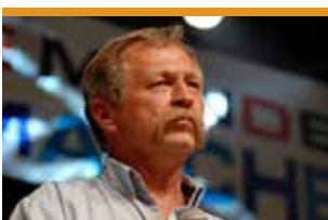
José Bové, activista altermundista i sindicalista francès, eurodiputat verd