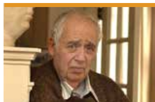
Harold Bloom, crític literari nord-americà